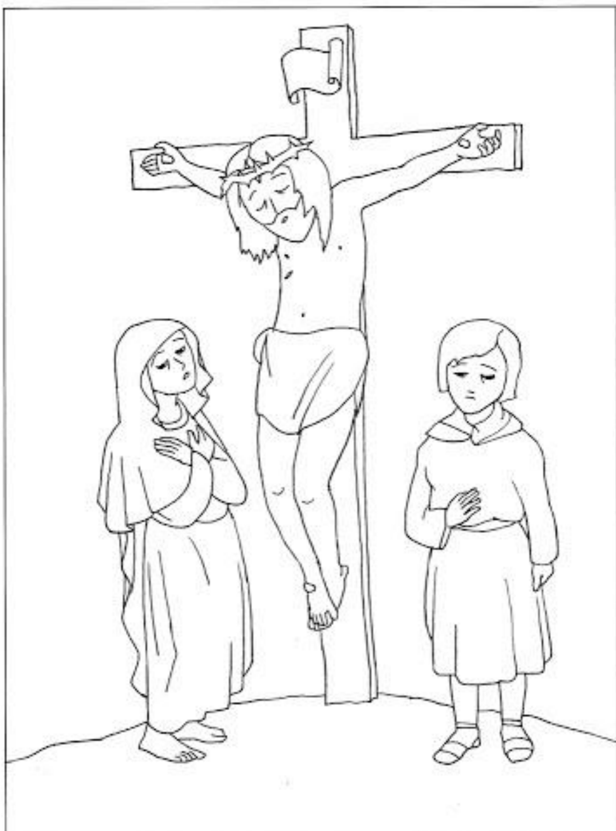
12. Pan Jezus umiera na krzyżu za zbawienie całego świata.